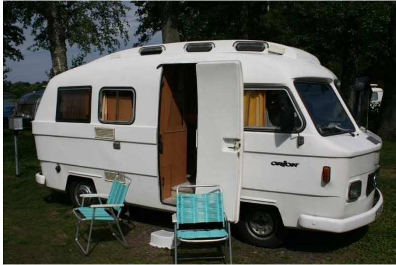
En Orion från Helsingör