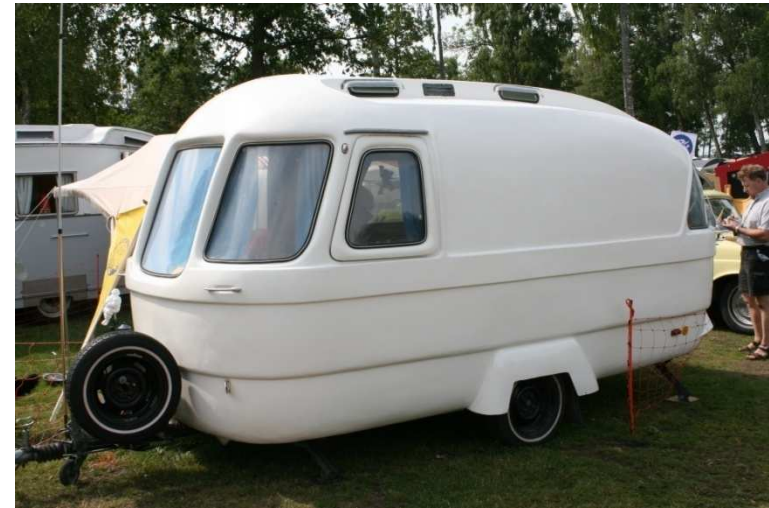
En Sulieca från Alfta