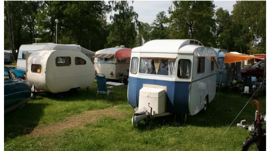
Rolands fidekomiss, Guillaumes Notin ( min numera ) och min Tencate på en bild 😊