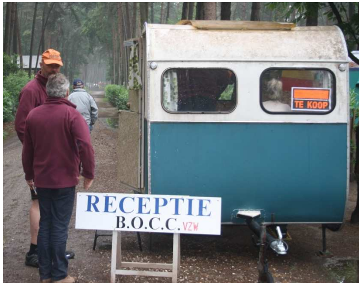
Incheckning under ordförändens vägledning