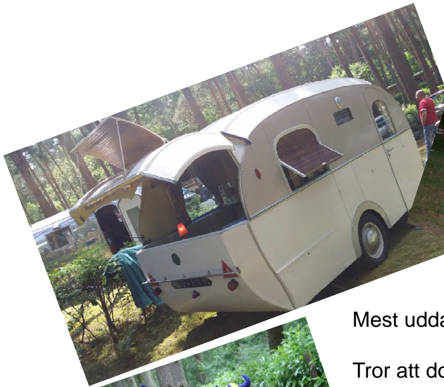
Mest udda vagnen.