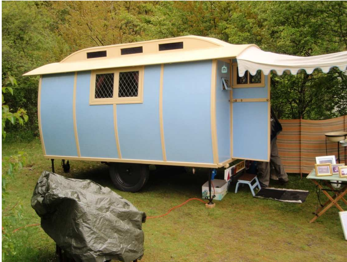
Träffens äldsta vagn 1927 från England . Tre svenska vagnar