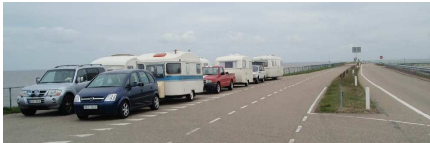
Hela gänget på Atlantvallen och senare ett besök på Loumann museum i Haag