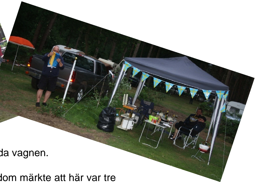
Tror att dom märkte att här var tre svenska pojkar på plats