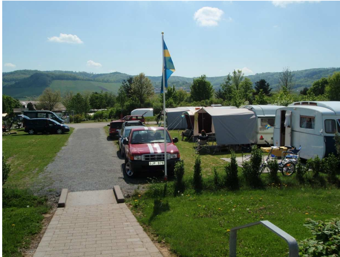
Svenskcampen med de tre ekipagen mitt i ett "märkelinlandskap"