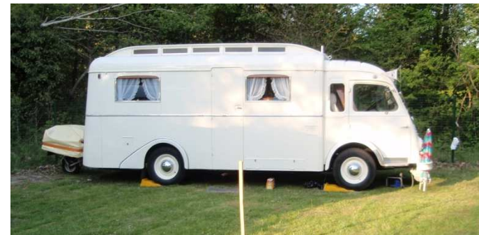
Notin husbil 1959