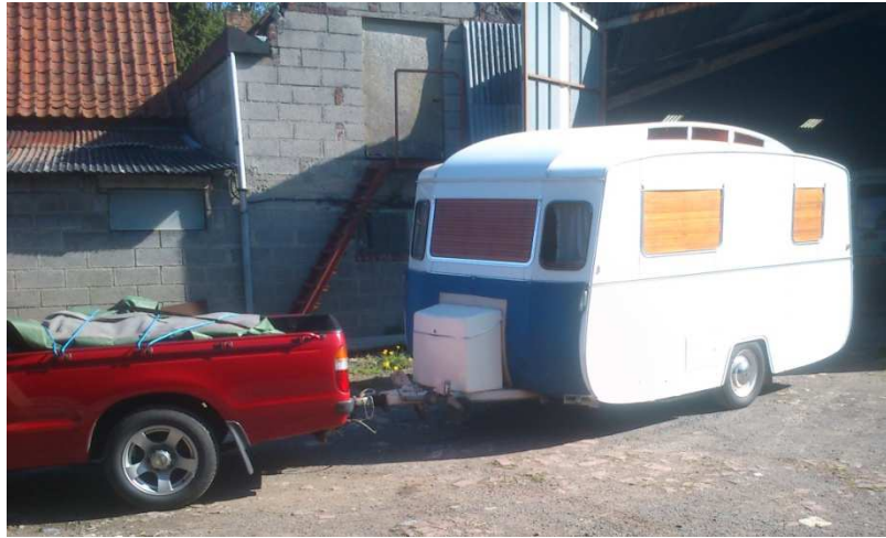
Ny vagn en Notin hämtad i Lille´