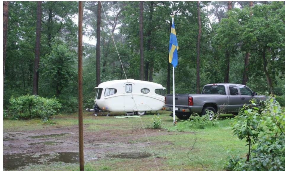
Vi har inte sol alltid. Fy vad det regna vid ankomsten. Kom på plats lagom genomvåta