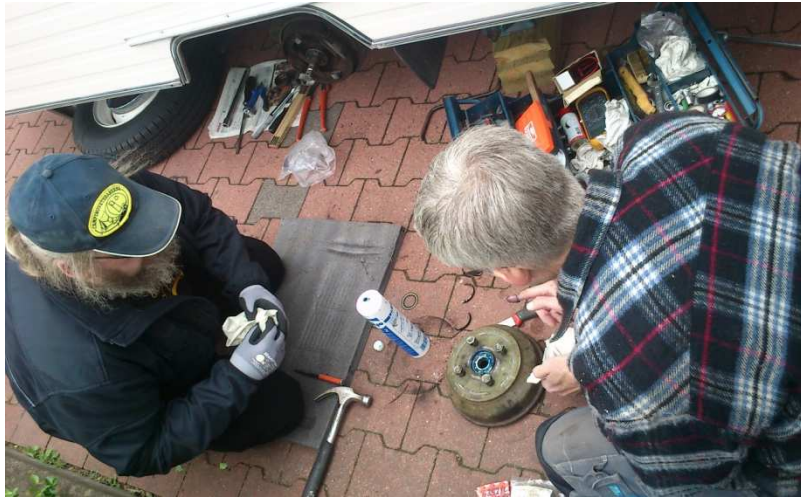
En timme på autobahn räckte för att knäcka ett hjullager