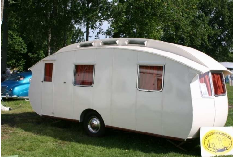
Träffens äldsta Cheltenham Eland 1947

Våran egen Europa träff som jag var med att arrangera tur man har glömt hur mycket jobb det var att vara arrangör